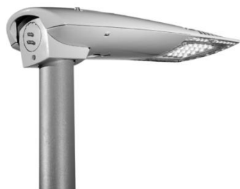
Schreder : Axia 2.1 26 watt