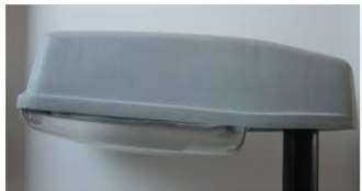
Philips: SGS 201, Son T 70 80 watt