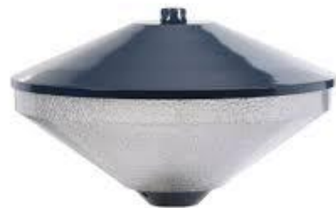
Lightronics : KFK PLL 24 w 30 watt