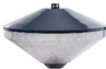
Lightronics : KFK led 13 watt